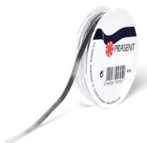
Deko-Band, silber. Art.-Nr. 9158130