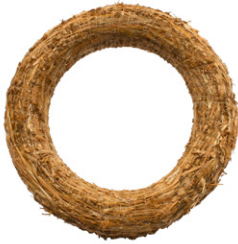
Strohrömer, ca. 30 cm. Art.-Nr. 4623021