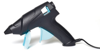
Heißklebepistole Pattex. Art.-Nr. 7283609