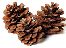
Tannenzapfen (9 Stück), natur. Art.-Nr. 6651020