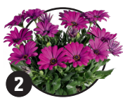
2 Paprskovka Doba kvetení: květen až září

Nazývá se také Osteospermum, existuje více než 70 odrůd.