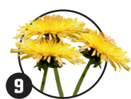
9 Smetanka lékařská Doba kvetení: duben až červen

Po odkvětu se vytvoří nažky s bílým chmýřím.