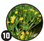
10 Pryskyřník Doba kvetení: květen až srpen

Po odkvětu se vytvoří nažky s bílým chmýřím.