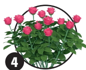
4 Růže Doba kvetení: květen až srpen

Cítí se dobře také ve stinném koutě zahrady.