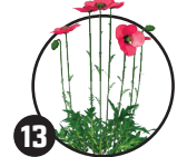
13 Vičí mák Doba kvetení: květen až červenec

Byla považována za polní plevel a dnes je téměř vyhubena.