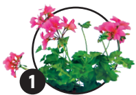
1 Pelargonie Doba kvetení: květen až říjen