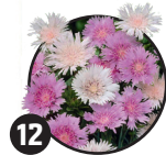
12 Chrpa modrá Doba kvetení: červen až říjen

Název pravděpodobně pochází z nějaké legendy.