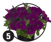
5 Petúnie Doba kvetení: květen až listopad

Existují jednou kvetoucí a častěji kvetoucí růže.