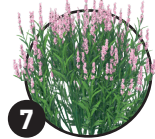
7 Levandule Doba kvetení: červen až srpen

Pro dlouhé období kvetení je třeba o ně dobře pečovat.