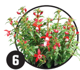
6 Fuchsie Doba kvetení: téměř celoročně

Při dobrém hnojení mohou neustále vytvářet nové květy.