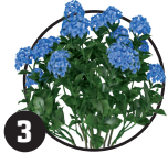
3 Hortenzie Doba kvetení: červen až září

Nazývá se také Osteospermum, existuje více než 70 odrůd.