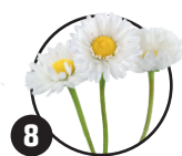
8 Sedmikráska chudobka Doba kvetení: téměř celoročně

Když ji sestříháte, kvete často ještě jednou.