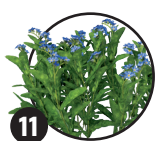
11 Pomněnka Doba kvetení: duben až říjen

Název pravděpodobně pochází z nějaké legendy.